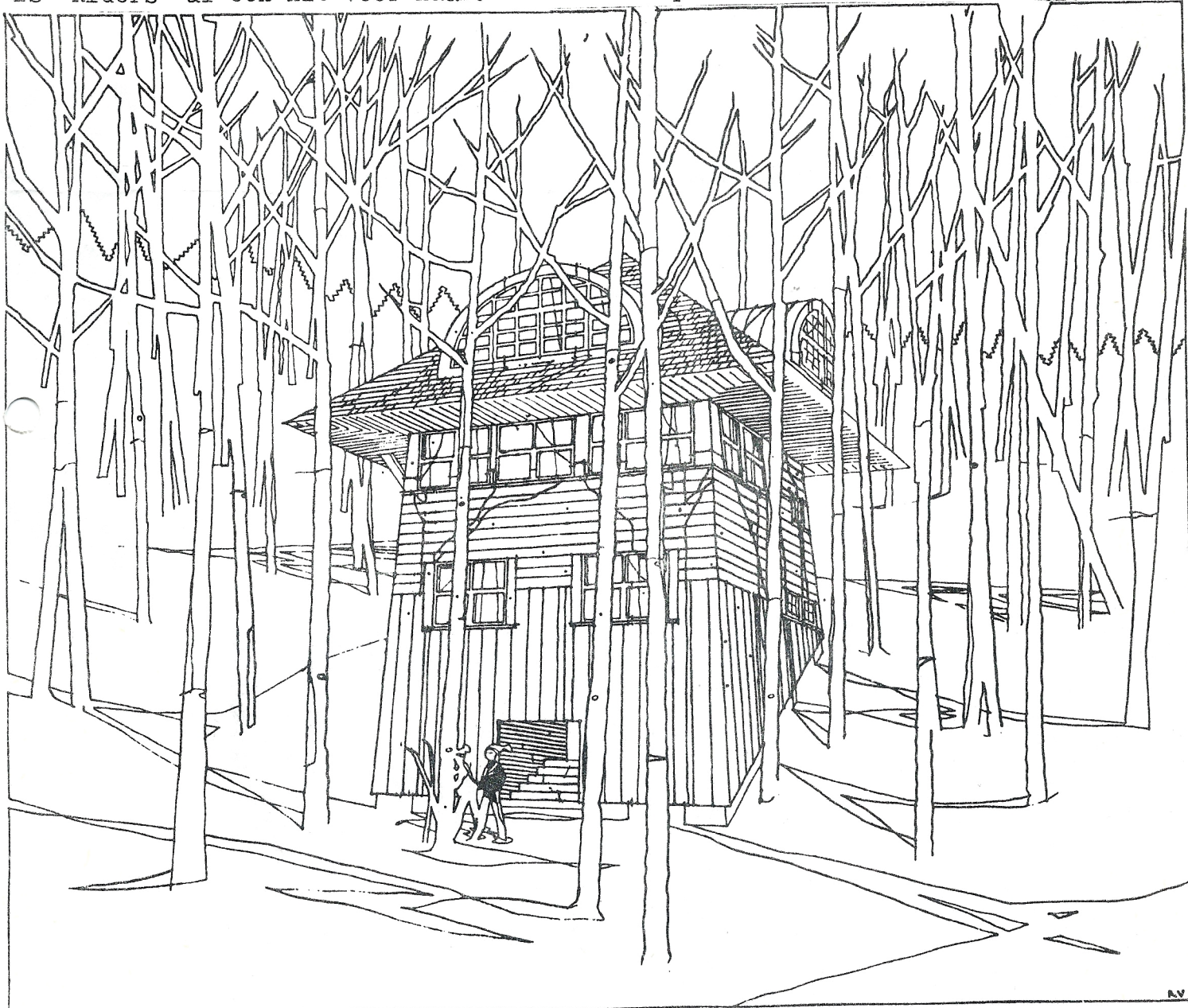
BRANT · JOHNSON HOVSE 1975 ~ VAIL VILLAGE · COLORADO

wij boden daarvan vast een eerste voorproefje met het nummer "You're the other Side". Het ziet er naar uit, dat deze elpee één van de beste Nederlandse popplaten gaat worden, want de cassette die wij als voorinformatie ontvingen klinkt ongelooflijk prachtig. Hoogtepunt van de plaat zou wel eens het Nederlandstalige "Wat is dit" kunnen worden, wat we ook nog in een live-versie op de plank hebben liggen, want toen de groep in Spleen 48 live optrad hebben we na de uitzending nog een half uur van ze opgenomen. Nadere informatie vind je in Spleenmagazine 48 pagina 4.